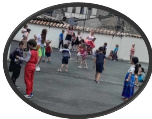
Les enfants jouent en musique

Durant cette année, des événements ont été proposés par l'équipe d'animation et les bénévoles de l'APIC qui œuvrent pour contribuer au bon fonctionnement de l'association.