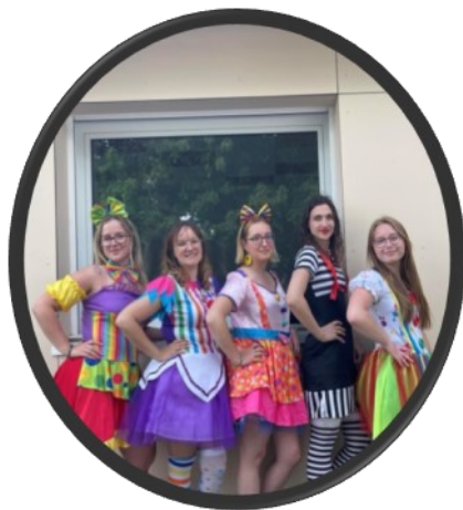
Les animatrices de l'APIC

L'année scolaire 2023-2024 vient de s'achever, et le mercredi 3 Juillet a été l'occasion de clôturer le thème du Cirque. Pour cette journée, les enfants ainsi que les animatrices étaient déguisés. Au programme : jeux musicaux, maquillages, tatouages paillettes ... De quoi passer une superbe journée