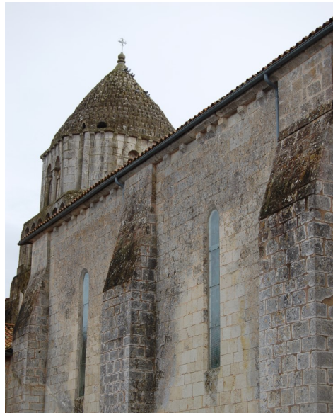
Vous connaissez cette église ?