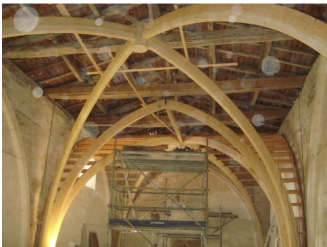
Comme vous ne l'aviez jamais vu !