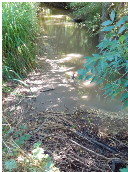
Le Tarnac, paisible