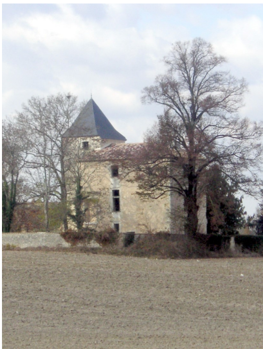
Un château à Nieul.....