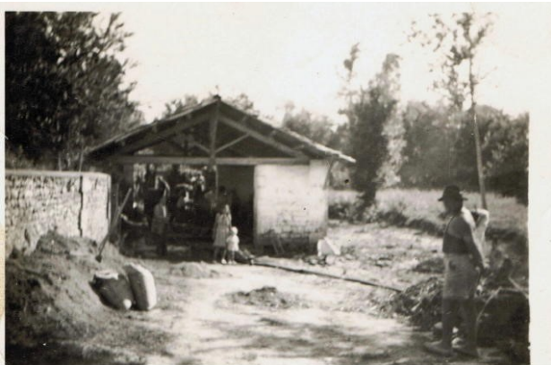
C'était il y a très longtemps