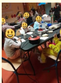
A table !!!...

La première animation a été la soirée pyjama, le vendredi 8 Mars de 19h à 22h30, pour le groupe des Ninjas ; muni de leurs plus beaux pilou-pilou, 22 enfants ont passé une soirée avec les animatrices. Au programme : croque monsieur/salade – diffusion d'un dessin animé – dégustation de Pop Corn – jeux collectifs.