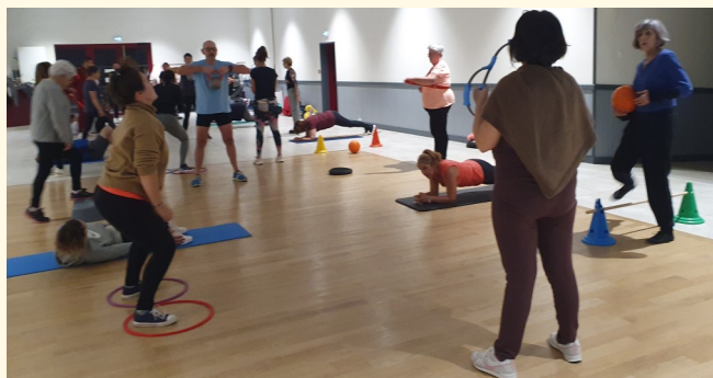
Le Club de Gym en action

Plusieurs ateliers y sont proposés avec différents accessoires entre tapis de sol, cerceaux ou petite marche .