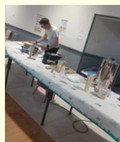
Le stand des délices sucrés et boissons