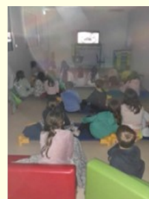
Chut ! Film en cours de diffusion... Il y a même des enfants qui font dodo

La deuxième animation proposée s'est déroulée le samedi 16 Mars. Un après-midi jeux de société était proposé à tous. Une trentaine de jeux pour tout âge (jeux en bois, jeux de carte incontournable, nouveautés...) étaient à disposition. Des crêpes et des gaufres été également proposés sur place.