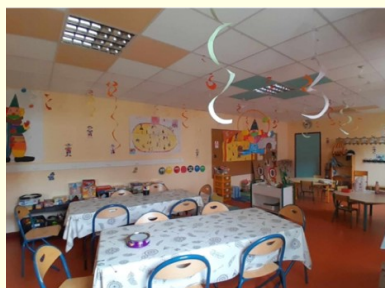
Les locaux de l'A.P.I.C. décorés par les enfants

Un court métrage sur les activités des enfants est en cours de réalisation. Il sera visible lors de notre assemblée générale qui aura lieu cette année le 31/05. Nous espérons vous voir nombreux et nombreuses.