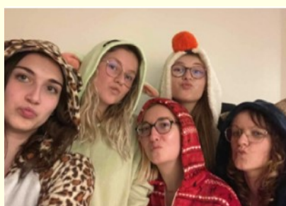
Les animatrices en pyjama