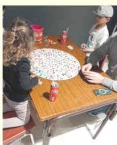
Jeux de société en Familles

Nous remercions les personnes qui sont venues participer à ce moment de loisirs entre amis et familles.