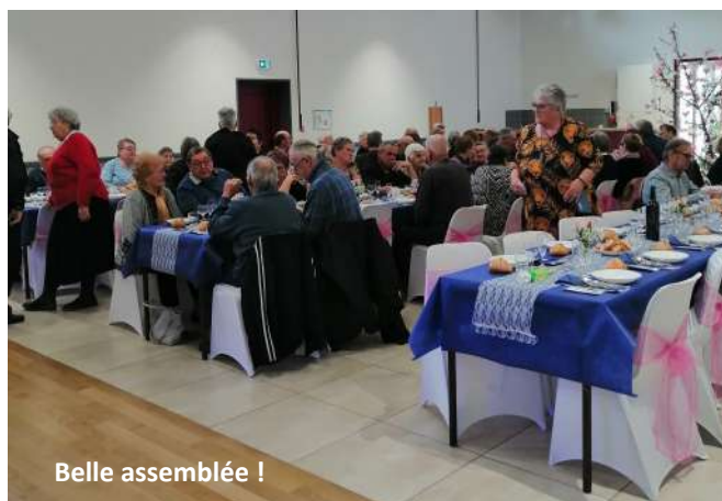
Belle assemblée !