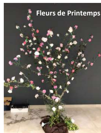
Flours de Printemps