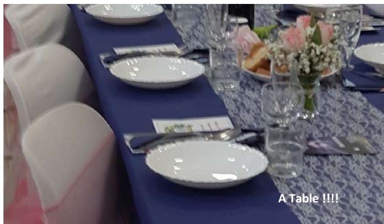
A Table !!!!