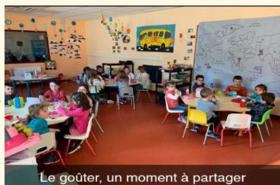
Le goûter, un moment à partager