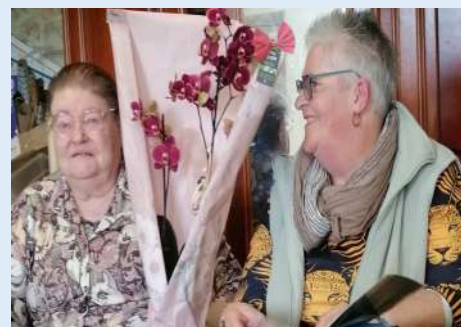
Passage de flambeau !

Les rencontres se feront les seconds et 4ème mercredi après midi de 14h à 18h à la salle des associations à partir du 26 avril, les principales activités se dérouleront autour des jeux, la belote par exemple et des jeux de société comme, le scrabble, les dominos etc..... On vous y attend nombreux et nombreuses, un goûter sera servi en fin de séance pour 2 euros. Pour renseignements complémentaires : 07 68 13 59 18