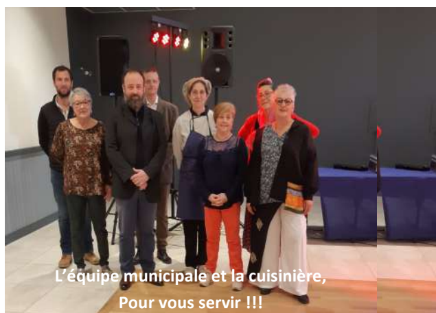
L'équipe municipale et la cuisinière, Pour vous servir !!!