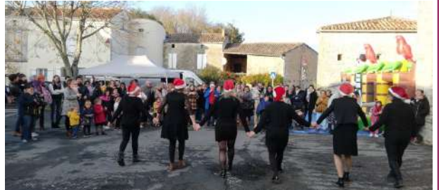
Un pas de danse pour le Père Noël

et se prépare à vous proposer de nouvelles manifestations.