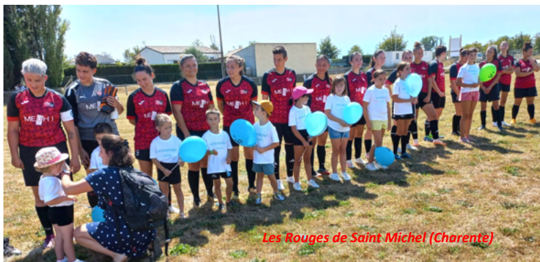
Les Rouges de Saint Michel (Charente)