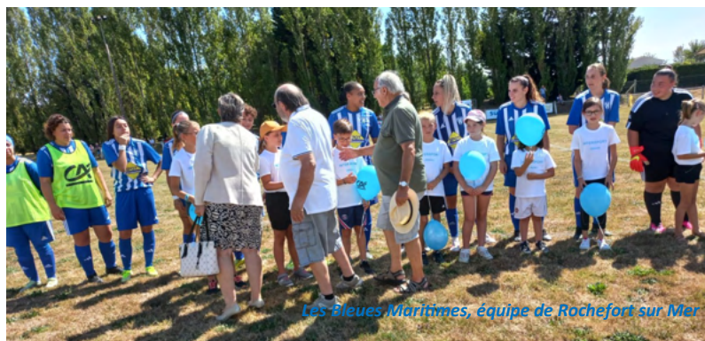
Les Bleues Maritimes, équipe de Rochefort sur Mer